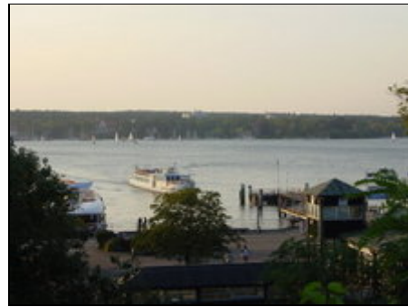
Dampferanlegestelle Wannsee fußläufig

Die Ferienwohnung befindet sich in exklusiver Wannseeelage, in einer Sackgasse, die im Wald und am Wasser endet. Die unmittelbare Umgebung wird von hochherrschaftlichen Villen der Gründerjahre bestimmt. Fußläufig können Sie nicht nur die Natur bis hin zu den Schlössern Potsdams erkunden, sondern auch in 10 Minuten zum Bahnhof Wannsee laufen, von wo aus Sie sicher, schnell und bequem mit den öffentlichen Verkehrsmitteln die City und das Umland erreichen. (City in weniger als 20 Minuten)