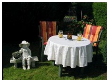
Mit kleinem Garten vor dem Haus

Im Münchner Osten, in sehr ruhiger Lage befindet sich die NEU renovierte 2-Zimmer Ferienwohnung. In unmittelbarer Nähe sind typisch bayerische Berggärten und der wunderbar grüne Ostpark mit seinem Biergarten am See. Mit Bus-U und S-Bahn erreichen sie schnell die Innenstadt sowie das Messegelände München oder auch den Flughafen. Direkte Verbindung zur Autobahn A8 mit herrlichen Ausflugszielen in die bayerischen Alpen. Chiemsee ca. 60 min. Bäcker und viele Restaurants in unmittelbarer Nähe.