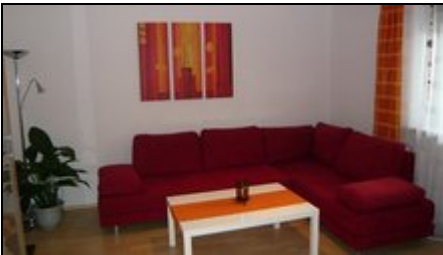
Wohnzimmer mit Schlafcouch

Exklusive moderne 2-Zimmerwohnung 60qm, im Münchner Osten. NEU renoviert im mediterranen Stil.