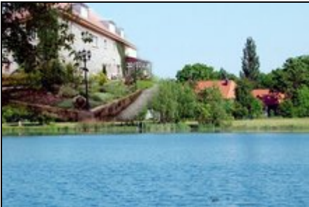
Geistmühle am See

Die fast 800 Jahre alte Geistmühle liegt direkt am Halberstädter See, einem beliebten Badeort. Die Ferienwohnung ist 53qm groß, mit Garten+eig. Zugang