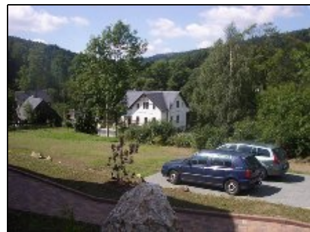
Blick zum Gasthof Brettmühle

Freizeitmöglichkeiten: Schwimm- und Spassbäder, Naturbühne Greifensteine, Theater, Kino, Fichtelbergbahn (Dampflok), Naturlehrpfade, ausgeschilderte Wander- und Fahrradrouten