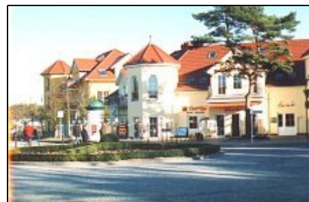
Strandvorplatz in der Vorsaison

Das 14. Usedomer Musikfestival findet vom 22.09.- 13.10.2008 statt