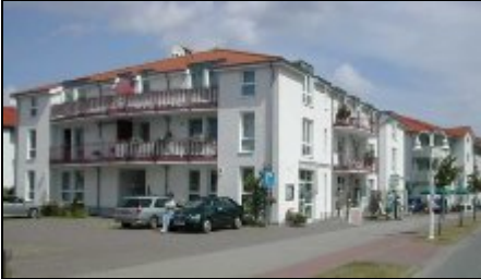
Aussenansicht mit Parkplatz

Die modern und exklusiv ausgestattete 3-Zimmer-Ferienwohnung liegt in einer 1999 fertig gestellten Wohnanlage ..