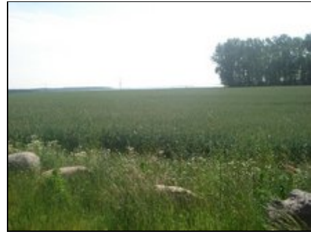
Der Feldweg nach Boldenshagen

Gesunde Seeluft, einsam und doch zentral: nächste Ortschaft Stadt Kröpelin (2 km) mit umfassenden Versorgungsmöglichkeiten, Bahnanschluss zu den alten Hansestädten Rostock und Wismar (je 30 Min.). Ostseebäder Rerik und Kühlungsborn mit großen Stränden knapp 10 km, Heiligendamm als ältestes Seebad ca. 12 km. entfernt. Malerische Landschaft zwischen Hügeln und Meer mit unzähligen Guts- und Herrenhäusern. Etwa 50-60 km bis zur Landeshauptstadt Schwerin mit Renaissance-Schloss.