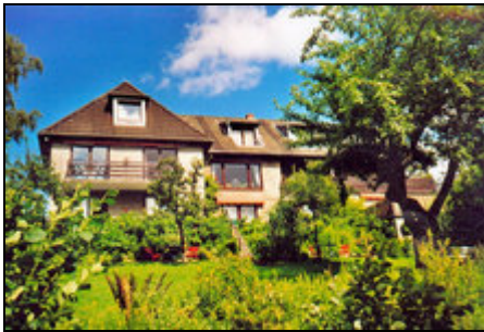
Pension Am Erlengrund Gartenseite