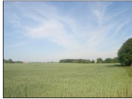
Blick auf Boldenshagen

Gesunde Seeluft, einsam und doch zentral: nächste Ortschaft Stadt Kröpelin (2 km) mit umfassenden Versorgungsmöglichkeiten, Bahnanschluss zu den alten Hansestädten Rostock und Wismar (je 30 Min.). Ostseebäder Rerik und Kühlungsborn mit großen Stränden knapp 10 km, Heiligendamm als ältestes Seebad ca. 12 km. entfernt. Malerische Landschaft zwischen Hügeln und Meer mit unzähligen Guts- und Herrenhäusern. Etwa 50-60 km bis zur Landeshauptstadt Schwerin mit Renaissance-Schloss.