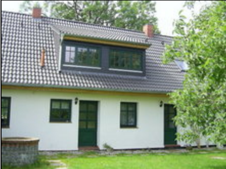
Gartenansicht Eingang Ferienwohnung

Eine große, liebevoll eingerichtete Ferienwohnung mit Kamin, nahe der Ostsee in ruhiger Lage, umgeben von Pferdewiesen mit großem Garten (4 Personen)