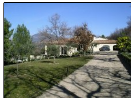
Privateintritt mit parkplatz

Ruhige, reizvolle Villengegend mit großen Gärten. Mehrere Supermärkte, zahlreiche Geschäfte und gute Restaurants in direkter Umgebung (2 km). Châteauneuf selbst ist ein schönes altes Dorf auf einem Hügel, abseits der Touristenströme. Nur 15 Minuten zum Meer (Cannes, Antibes), 25 Minuten bis Nizza. Viele interessante Museen ganz in der Nähe. Auch Ausflugsmöglichkeiten ins malerische Hinterland.