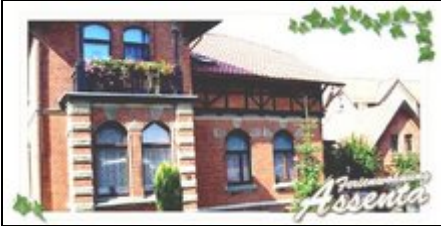
Das Haus in der Elisabethstr. 5