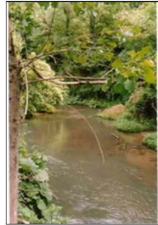
Badebach unterhalb des Hauses

Die unmittelbare Umgebung ist voller Vögel und Rehwild. In wenigen Minuten Fußweg sind Sie in der Stille des Buchen- oder Macchiawaldes mit den sauberen Flübchen zum Baden. Wander- und Radtouren ohne Autoverkehr vor der Tür. Die wildromantischen Felsenorte PITIGLIANO, SOVANO und SORANO sind in wenigen Autominuten erreichbar, wo Sie Restaurants, Geschäfte, Thermalquellen und Museen finden. Die 2006 eröffnete Thermalbadelandschaft von SORANO/Pitigliano ist wohl eine der schönsten Italiens .