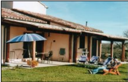
SAN PIETRO li Leccio, re. GELSO

Ein ökologischer Bauerhof in stiller, romantischer Gegend, von 2 Flußtälern (Baden möglich) und Wein- und Olivenfeldern umgeben. Alle Mahlzeiten. Wifi.