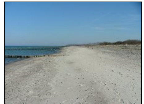
Naturstrand im März 2007

Der idyllische Ferienort Börgerende liegt direkt am Ostseestrand zwischen den Städten Kühlungsborn und Rostock-Warnemünde in unmittelbarer Nachbarschaft zum ersten deutschen Ostseebad Heiligendamm. Der naturbelassene Strand ist hauptsächlich sandig. In östlicher Richtung prägen Steilküste und der "Gespensterwald", der seinem Namen alle Ehre macht, den Küstencharakter. Für ausgiebige Tagestouren bietet die Region gut ausgebaute Rad- und Wanderwege.