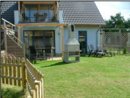
Terrasse mit Sonnensegel und Grill