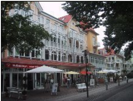
Ansicht von der Strandseite