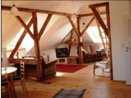
Wohnzimmer mit Essplatz

Großzügige, helle und ruhige Dachgeschoßwohnung in Zweifamilienhaus am Schloss Schönhausen in Pankow. Ideal für den erholsamen Berlin-Aufenthalt.