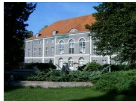
Schloss Schönhausen (vor d. Renovierung)

In Berlin Pankow Niederschönhausen, am geschichtsträchtigen Majakowskiring. Parks: Schönholzer Heide, Schlosspark & Bürgerpark. Viele Einkaufsmöglichkeiten vor Ort (Supermärkte 200m, Einkaufsstraße & EKZ 800m). Kino Blauer Stern 200m. Gute Verkehrsanbindung: Tram & Bus 200m, U- und S-Bahnhöfe (Pankow, Schönholz) 1,5km. Prenzlauer Berg (Schönhauser Allee 3km) ist mit der Tram M1 in 15 min erreichbar. Alex, Friedrichstraße, Potsdamer Platz & Zoo mit Bus & Bahn in ca. 30 min erreichbar