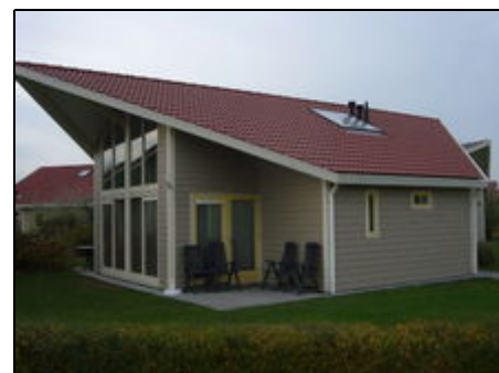
villa 6 personen

!!ALLES DA FÜR SUPERFERIEN FÜR DIE GANZE FAMILIE!!