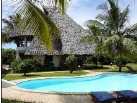
Villa Kusini mit Pool

Traumvilla an der Südküste in Kenia, 1600 qm Grundstück mit Pool 11x6m, inkl. Koch/Cleaner, Gärtner/Poolreinigung, ca.550 m zum Traumstrand Diani Beach