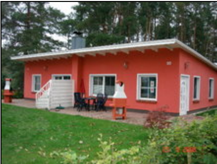
Frontansicht Nr. 91/ 92