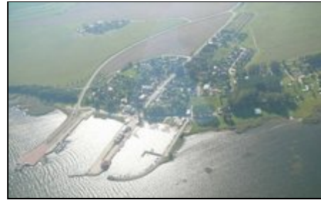
Stahlbrode während eines Rundfluges.

Fischerdorf Stahlbrode, d.h. Frischfisch der Saison und Räucherfisch direkt beim Fischer kaufen. 300 Einwohner zählt das ruhige Dorf. Stahlbrode ist von der sehenswerten Hansestadt Stralsund ca. 15 km und von der Hansestadt Greifswald ca. 20 km entfernt. Stahlbrode bietet von April bis Oktober/November direkte Ausflugsmöglichkeiten zur Ostseeinsel Rügen aufgrund der Fährverbindung nach Rügen/ Glewitz.