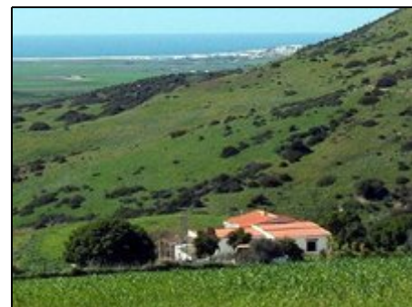
Blick auf Haus/Atlantik

Die interessante andalusische Kleinstadt Vejer befindet sich in 7km Entfernung. Die Küstenorte Barbate (17km), Conil (12km) und Chiclana (30km) sind bequem zu erreichen. Von dort aus lassen sich Bootsfahrten, Tauchgänge oder Surfkurse organisieren. Für Städtebummel und Sightseeing bieten sich Cadiz (40km), Gibraltar (100km), Jerez (70km), Sevilla (150km) und viele kleinere Ortschaften an.