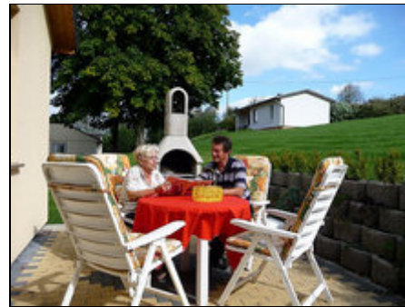
Sonnenterrasse mit Kamingrill

Crawinkel, am Fuße des Thüringer Waldes gelegen, ist idealer Ausgangspunkt für Tagestouren zu den interessantesten Städten Thüringens: Weimar, Erfurt, Gotha, Eisenach, 9 km bis Oberhof - Wandertouren auf dem Rennsteig, Mountainbiken im Thüringer Wald, Jonastal, Crawinkel selbst bietet ideale Bedingungen für Gleitschirmflieger, Angelmöglichkeiten 1000 m vom Haus entfernt, Ausflüge zu den benachbarten Talsperren sind zu Fuß und mit dem Fahrrad ein Erlebnis.