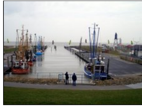
Der Kutterhafen mit Surfern

Für Aktivitäten gibt es in Dorum viele Möglichkeiten. Sie erleben Ebbe und Flut, ein Naturereignis der besonderen Art. Der idyllische Kutterhafen ist ein täglicher Anziehungspunkt. Die Strandhalle mit Kurverwaltung und Gastronomie, das Nationalpark-Haus und das Kinderspielhaus befinden sich direkt am Strand. Wattwandern, Reiten, Ponyreiten, Kutterfahrten, Piratenfeste und vieles mehr bietet Abwechslung und Spaß. Die Seestädte Bremerhaven und Cuxhaven sind immer einen Besuch wert.