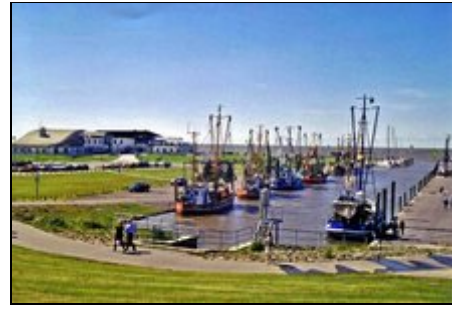
Kutterhafen mit Kinderspielhaus

Für Aktivitäten gibt es in Dorum viele Möglichkeiten. Sie erleben Ebbe und Flut, ein Naturereignis der besonderen Art. Der idyllische Kutterhafen ist ein täglicher Anziehungspunkt. Die Strandhalle mit Kurverwaltung und Gastronomie, das Nationalpark-Haus und das Kinderspielhaus befinden sich direkt am Strand. Wattwandern, Reiten, Ponyreiten, Kutterfahrten, Piratenfeste und vieles mehr bietet Abwechslung und Spaß. Die Seestädte Bremerhaven und Cuxhaven sind immer einen Besuch wert.