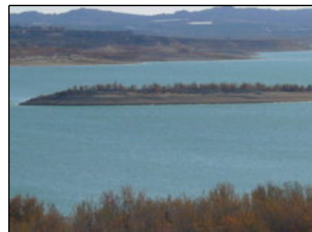
Der Stausee mit Angelmöglichkeit

Die Stadt Torrevieja und die schönen Sandstrände sind etwa 4 km entfernt. Einkaufsmöglichkeiten, Restaurants, Apotheke, befinden sich in der Urbanisation; Einkaufszentrum, Supermärkte, Casino, Kino, Bowlingbahn ca. 2 km entfernt. Wanderwege führen um die Lagunen von Torrevieja und La Mata (Naturschutzgebiet). In der näheren Umgebung befinden sich 5 Golfplätze, weitere Ausflugsziele: Insel Tarbarca, Guadalest, Freizeitparks in Benidorm.