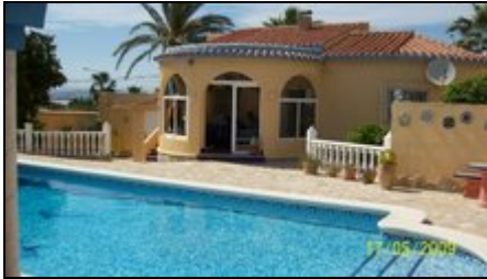
Der Poolbereich nach Süden ausgerichtet

Erholsamer Urlaub in gepflegtem Ferienhaus mit eigenem, großem Pool. Klimaanlage und Telefon/Internet. ****nur noch vom 23.6.-7.7.12 frei****