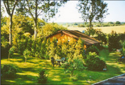
Ferienhaus im Sommer

Ferienhaus im Grünen auf 4000 m 2 abgeschlossenem Grundstück, idyllische ruhige Lage mit unverbautem Blick. Spielplatz, Spielwiese, Strand- und Waldnah