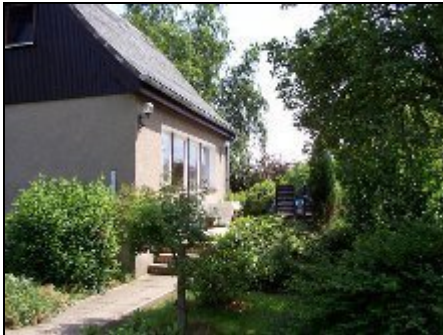
Südansicht mit Blick auf die Terrasse

Ruhig gelegenes Ferienhaus für 2 Erwachsene und 2 Kinder mit Küche, Bad, Wohnzimmer und 2 separaten Schlafräumen. Pkw-Stellplatz und Terrasse vorh.