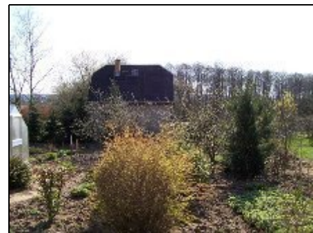
Nordansicht mit Blick auf den Garten

Der Strand ist einen schönen Spaziergang (ca. 1500 m) entfernt. Dort ist eine Haltestelle der Bäderbahn Molln, von dort erreichen Sie Heiligendamm, Bad Doberan oder Kühlungsborn. Das Radwegenetz in der Region ist sehr gut ausgebaut (u.a. Europäische Radwanderwege). Wismar und Rostock erreichen sie in ca. 40 Minuten mit dem PKW, von dort gibt es Fährverbindungen nach u.a. Dänemark. Im 4 Kilometer entfernten Ostseebad Kühlungsborn bieten sich sehr gute Einkaufs- und Freizeitmöglichkeiten