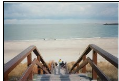
800 m bis zum Meer und nur eine Treppe

Der Park liegt am Brouwersdam, etwa 800 m von der Nordsee und 1 km vom Grevelinger Meer, dem größten und saubersten Salzwassersee der Niederlande. Hier bieten sich Erholungsmöglichkeiten der offenen Nordsee u. des Binnenmeeres. Der Sandstrand erstreckt sich über 17km von Ellemeet bis Westenschouwen. Für Radfahrer gibt es gut ausgebaute Radwege durch Dünen und Wälder. Ein Besuch des Neeltje Jans vermittelt einen Einblick in die Beziehung der Niederländer zum Meer. Gute Einkaufsmöglichkeiten