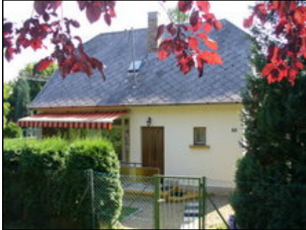
Vorderansicht mit Eingang