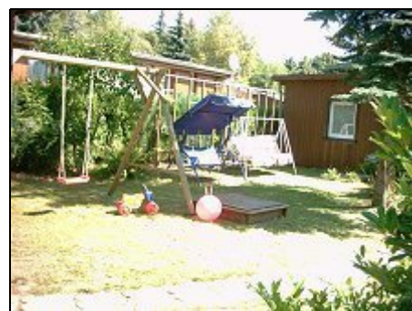
Ansicht auf Liegewiese mit Schaukeln

Weitere Höhepunkte sind die Westernstadt Pullman City II (in ca. 7 Km Entfernung), die Stadt Thale mit dem Hexentanzplatz, der Roßtrappe u. die Harzer Schmalspurbahnen, welche ihre Gäste mit Dampfzügen auf den höchsten Berg des Harzes, den Brocken, fährt.