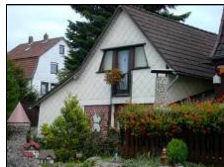
Ferienhaus von der Wohnzimmerseite

Rund um Walkenried befinden sich reizvolle Angelteiche mit gutem Fischbestand. Die Kurorte Bad Sachsa, Bad Lauterberg sowie Braunlage, mit ihren umfangreichen Kur-, Freizeit- und Einkaufsmöglichkeiten, liegen nur ca. 5 bzw. 20 Minuten entfernt. Die historischen Altstädte von Nordhausen, Goslar, Wernigerode, Blankenburg, Bad Harzburg, Osterode, Herzberg, Duderstadt sowie Stolberg liegen jeweils nur 30-60 Autominuten entfernt. Skigebiete für Langlauf sowie Abfahrt sind in 20-30 Minuten erreichbar.