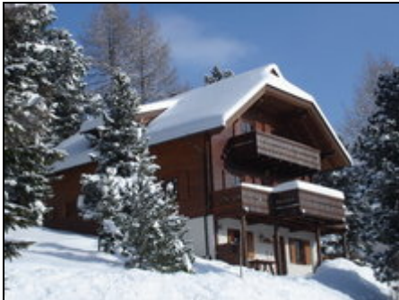
Chalet Sonnenalm im Winter