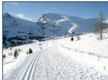
Höhenläupe auf 1800m oberhalb der Baumgr

Drei Skigebiete in der Nähe: Falkertsee, Bad Kleinkirchheim, St. Oswald und Turracherhöhe. Herzlich willkommen im Sommer auf den lieblichen Almhöhen des Naturparks Nockberge. Im Sommer können Sie herrlich entspannen beim Almwandern, Golfspielen, Tennisspielen, Baden usw. Auch für ihre Gesundheit wird gesorgt in den großzügigen Thermalhallenbädern von Bad Kleinkirchheim.