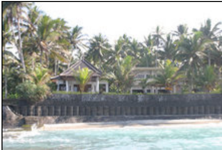
Blick vom Meer

Die Anlage besteht aus dem Haus - das von den Eigentümern bewohnt wird - und 2 Appartements.