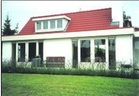
Gartenzimmer von außen mit Sitzbank

Individuelles, komfortables Haus am Schelde-Deich, ideal für Radfahrer, Angler & Wassersportler. Antwerpen, Gent & Badestrände ca. 30 min. entfernt.