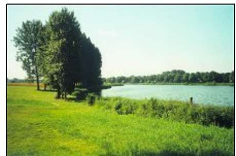
Blick aus dem Gartenzimmer auf den See

Direkt vor dem Haus liegt ein Weg mit Badestelle, Spielplätzen & Trimpfad. Die Umgebung, teils urban, teils ländlich mit pittoresken Ortschaften lädt zum Radfahren ein. Kultur & Shopping auf höchstem Niveau erleben Sie in Antwerpen & Gent, zu Stränden führt der Scheldetunnel auf die beliebte Ferieninsel Walcheren mit vielen Touristenzentren. Urlauber-Rummel gibt es in Othene nicht, dies ist ein typ. holländ. Wohnort mit altem Kern & neuen Vierteln. Bes. Attraktion: IndoorSkipiste.