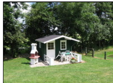
Großer Garten Gartenhaus mit Grill

2 gemütliche Ferienwohnungen, neue Holzfenster, Insektenschutzrollo, neue Bäder mit Fußbodenheizung, ebenerdig mit separaten Eingängen. Ein schöner Garten mit Sitzzecke, Strandkorb, Sonnenliegen und Sandkiste viel Platz für Kinder zum Spielen. Kinderreisebett und Hochstuhl. Fahrräder stehen kostenlos zur Verfügung. Mit Unterstellplatz für Ihre Fahrräder oder Motorräder. Anreise 14 Uhr, Abreise 10 Uhr. Bei Buchung bitten wir um eine Vorrauszahlung von 50€ pro Woche. Restbetrag bitte bei Ankunft bezahlen