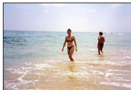
Baden am Sunny Day Strand

Der Goldstrand, der Strand St. Konstatin und andere Bilderbuchstrände sind leicht mit den Buslinien oder mit dem PKW zu erreichen. Die Stadt Varna ist 3 Km von der Villa entfernt, wo Ihnen die Möglichkeit geboten wird Museen, Folklore, Musikfestspiele, Internationale Ballettwettbewerbe, gemütliche Cafés zu besuchen. Zum Ausklingen eines schönen Tages empfehlen wir Ihnen einen Besuch in unserem Weltberühmten Opernhaus.