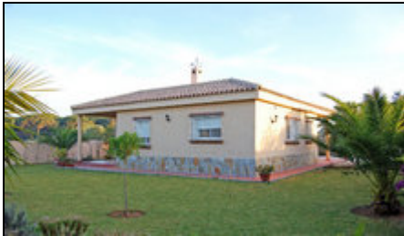
Ein Haus zum rundum Wohlfühlen!

Ein kleines Paradies, nur 1-2 km vom traumhaften Strand entfernt befindet sich dieses ruhige, gemütliche Landhaus mit großem, blühendem Garten.