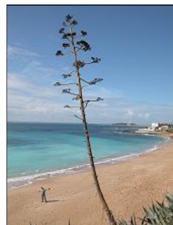
in der Nähe .... der Traumstrand!

Zum wunderschönen Strand sind es nur 1-2 km. In der Nähe befinden sich Felder, der Pinienwald und einzelne Häuser. Zum Ortszentrum von Conil sind es 3-4 km. Bestes Bio-Obst und -Gemüse ist direkt beim Nachbarn erhältlich. Mehrere Golfplätze von hohem Standard befinden sich im Umkreis von wenigen Kilometern, so in Novo Sancti Petri und in Vejer (Montenmedio). Bitte beachten Sie hierzu die Linkliste der Homepage.