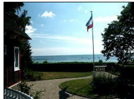
Strand direkt vor dem Anwesen

Direkt vor dem Ferienhaus kann der kilometerlange Badestrand von Sierksdorf/Haffkrug genutzt werden. Einkaufsmöglichkeit im Ortszentrum Haffkrug (5 Gehminuten), Supermärkte in Neustadt (5 km). Sierksdorf liegt an der "Holsteinischen Schweiz" mit zahllosen Ausflugsmöglichkeiten (z.B. Holstein-Musikfestival, Plöner Seenplatte, Karl May-Festspiele in Bad Seegeberg, Hansapark Sierksdorf, Lübeck u.v.m.).