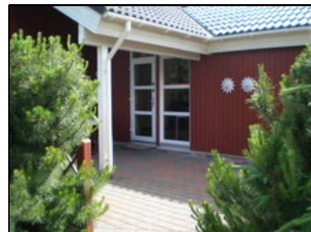
der Aufgang zum Haus

Das Haus liegt nur ca. 10 km von den wunderschönen Dünen und Sandstränden der Nordsee (Vejers Strand, Grerup, ...) entfernt. Im Ferienland gibt es einen Supermarkt mit Grillbar, Kinderspielplatz, Tennisplätze sowie eine Minigolfanlage. Für Radfahrer ist die Umgebung sehr geeignet. Im Nachbarort Oksbøl (6 km) gibt es ein Hallenbad mit Wasserrutsche usw.