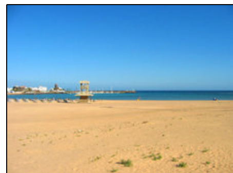
Strand, 1 Gehminute vom Haus entfernt

Der auch für Kinder perfekt geeignete Sandstrand ist fast vor der Haustüre. Zur Thalasso-Therapie sind es nur 3 Minuten, zum neu eröffneten Golfplatz nur 3 Minuten mit dem Auto. Caleta de Fuste liegt in der Mitte der Insel an der Ostküste und damit zentral zu allen interessanten Ausflugszielen auf der Insel. Die Hauptstadt Puerto del Rosario ist mit dem Bus und dem Auto in 20 Minuten zu erreichen