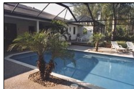
Pool / Terrasse

Lehigh Acres mit ca. 68000 Einwohnern liegt etwa 15 Meilen östl. von Ft. Myers. Sie ist zentraler Ausgangspunkt für Tripps zu den Themenparks bei Orlando, nach Miami jeweils (ca.2,5 Std.) und den Everglades (ca. 1 Std.). Supermärkte, Tennis- und Golfanlagen sind vorhanden. Die Strände von Ft. Myers Beach und den vorgelagerten Inseln Sanibel und Captiva sind in 45 Min. zu erreichen.