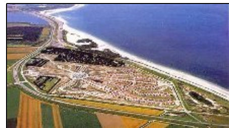
Luftbild des Parks

Der Ferienpark liegt zwischen Nordsee, Oosterschelde und Veerse Meer. Er bietet die perfekte Ausfallbasis um Zeeland zu entdecken. Außerdem hat der Park einen der saubersten und schönsten Nordseestrände der Niederlande. Die Umgebung lädt zu vielen Ausflügen ein. Domburg, Middelburg und Veere sind nur wenige Kilometer entfernt. Fahrradverleih, Schwimmbad, Minigolf und Kinderbetreuung sind im Park.