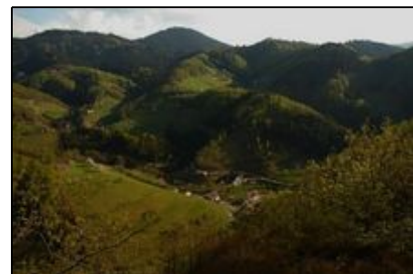
Maisachtal vom Maisacher Grat aus

Unser Häuschen liegt inmitten grüner Hügel, Wiesen und Wälder im idyllisch gelegenen Dörfchen Maisach ca. 3 km von Oppenau entfernt. Vom Häuschen aus hört man das Rauschen des Baches. Wir bieten eine ruhige Lage in einem romantischen Nebental der Rench (kein Durchgangsverkehr), viele Wander- und Ausflugsmöglichkeiten z. B. nach Freudenstadt, Baden-Baden, Straßburg oder in den Europa-Park Rust. Gute Möglichkeiten zum Mountainbiken, Paragliding, Skilifte und Loipen in 15 Fahrminuten erreichbar.