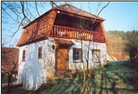
Das Landheim vom Garten aus gesehen

Mitten im Wald gelegen, hat der Ransbrunnerhof eine über 800 jährige Geschichte. Wir leben von einer vielseitigen Landwirtschaft in herrlicher Natur..