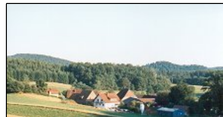
Blick über unser Tal

Unser Hof liegt am westlichen Rand des Biosphärenreservates Pfälzer Wald, ca. 3 km vom Luftkurort Eppenbrunn und ca. 5 km von der franz. Grenze entfernt. Direkt ab Hof oder nach kurzer Anfahrt führen Wanderwege durch herrliche, einsame Natur zu Sandsteinfelsen und Burgen. Weitere Ziele sind: Südl. Weinstraße, Biosphären-Haus Fischbach, Outlet-Center Zweibrücken, Spiel- u. Wildparks, Badeseen, 3 modene Hallenbäder in max. 20km Entfernung. Gut zu erreichen sind Lothringen und das Elsaß mit Straßburg.