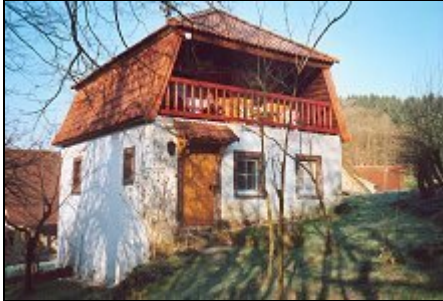
Das Landheim vom Garten aus gesehen