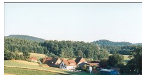
Blick über unser Tal

Unser Hof liegt am westlichen Rand des Biosphärenreservates Pfälzerwald, ca. 3 km vom Luftkurort Eppenbrunn und ca. 5 km von der franz. Grenze entfernt. Direkt ab Hof oder nach kurzer Anfahrt führen Wanderwege durch herrliche, einsame Natur zu Sandsteinfelsen und Burgen. Weitere Ziele sind: Südl. Weinstraße, Biosphären-Haus Fischbach, Outlet-Center Zweibrücken, Spiel- u. Wildparks, Badeseen, 3 moderne Hallenbäder in max. 20km Entfernung. Gut zu erreichen sind Lothringen und das Elsaß mit Straßburg.