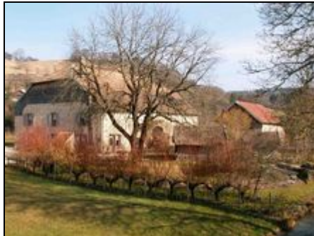
Ferienwohnung im Jura - Frankreich

Schönes Bauernhaus aus dem Jahre 1863 im grünen Tal von Lison (Kalkstein Schluchten, Wasserfälle und Wälder). Cottage sehr komfortable 4-Sterne.