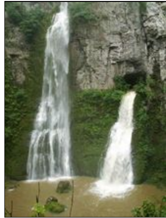
Wasserfälle und Quellen Lison