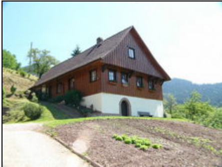
Ferienhaus zum allein bewohnen

Verbringen Sie traumhaften Urlaub auf dem Müllerbauernhof. Wir vermieten ein Ferienhaus zum allein bewohnen sowie 2 Ferienwohnungen für 2-13 Pers.