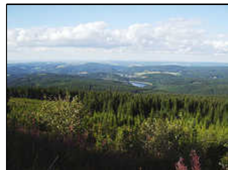
Blick vom Auersberg

Henneberg ist für Natur- und Sportfreunde bestens geeignet. In unmittelbarer Nähe unseres Hauses verläuft der Euro-päische Fernwander- und Radweg E3. Die zahlreichen Kammwegradtouren sind einfach bis anspruchsvoll und sehr abwechslungsreich. Die Wintersaison in der schneesichersten Gegend Deutschlands nördlich der Alpen bietet über 150 km gespurte Loipen. Die Kammloipe trägt das DSV-Prädikat Exzellente Loipe. Zwei Abfahrtschänge mit Lift und Beleuchtung befinden sich in der Nähe (mit PKW).