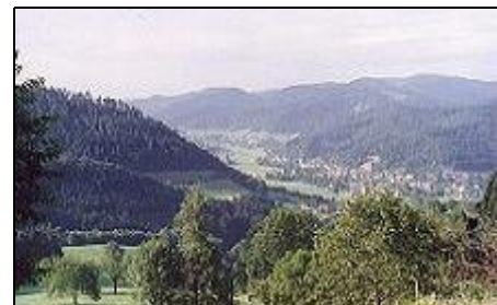
Herrliche Aussicht direkt vom Häuschen

Geradezu ein Muß für jeden Gast ist der Besuch des Freilichtmuseums Vogtbauernhof, das naturgetreu das Leben vorheriger Generationen demonstriert. Der "Park mit allen Sinnen" die Natur erleben in Gutach bietet vielfältige Entspannung. Triberg, die Stadt der Uhren, hat auch Deutschlands höchsten Wasserfall. Der Europapark Rust ist, besonders für Kinder, einen Tagesausflug wert. Weitere sehenswerte Ausflüge nach Freiburg, Baden-Baden, Colmar, Straßburg, Titisee, Blumeninsel Mainau sind verlockende Ziele.