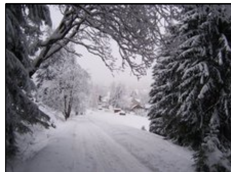
Einladung zum Spaziergang...

Pernink (deutsch Bäringen) liegt ca. 900 m.ü.d.N. im Erzgebirge an der Deutsch-Tschechischen Grenze, 10 km vom Grenzübergang Oberwiesenthal/Bozi Dar, ca. 20 km von der weltberühmten Kurstadt Karlsbad. Viel Wald, Bergwiesen, Wanderwege und ... für Mountainbiker ideal. Bademöglichkeiten in Karlovy Vary (Thermal) oder Potucky (Klein-Schwimmbad), Zoo-Park in Chomutov, Burg Loket, Aussichtsflyge von Karlsbad möglich. Bergwerkmuseen in Jachymov und Horni Blatna. Auch Faulenzen ist natürlich möglich.