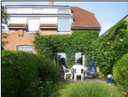
Ansicht vom Garten

Ferien-Reihenhaus, 95 qm, ruhige Lage, Natur pur, Entfernung zum Strand ca. 2 km, im Übergangsbereich zwischen Flensburger Förde und Geltinger Bucht