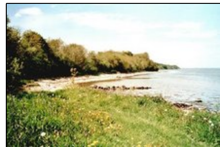
Mühlendamm : 2.Bucht

nächste Strände: Mühlendamm, Habernis. Glücksburg mit dem bekannten Wasserschloss u. Wellenbad. NSG Geltinger Birk an der Geltinger Bucht.NSG Tal der Langballigau mit anschließendem Badestrand. Kappeln mit Hafen. Wikingermuseum u.Häuser an der histor. Anlage Haithabu bei Schleswig. Flensburg am Ende der Förde mit Hafen u. vielen restaurierten Innenhöfen. Schiffstouren in die dänische Inselwelt. Auf der Fahrt an die Nordsee können Sie Friedrichstadt mit seinen Grachten u.Schiffstouren besuchen