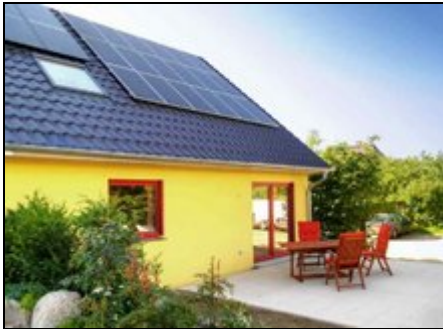
Haus Meerzeit: Terrasse

Ferienhaus (DHH), Neubau 2010, kinder- und allergikerfreundl., Nichtraucher, 125m 2 , 3 Schlafz. bis 7 Pers., Garten und Terrasse, 2xPKW-Stellplatz